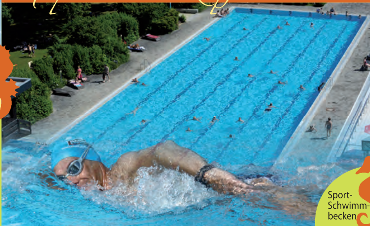
Sport- Schwimm- becken

Nicht nur das Springerbecken mit 1 m und 3 m Sprungbrett und das 50 m Sport-Schwimmbecken verführen ambitionierte Freizeitschwimmer zu sportlichen Leistungen, auch das Beachvolleyballfeld und die Tischtennisplatten erfreuen sich bei sportlichen Teams großer Beliebtheit. Wir bieten auch Schwimmkurse für Kinder und die Abnahme von Schwimmabzeichen an.