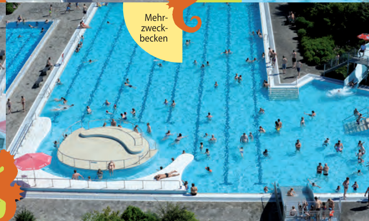
Mehr- zweck- becken